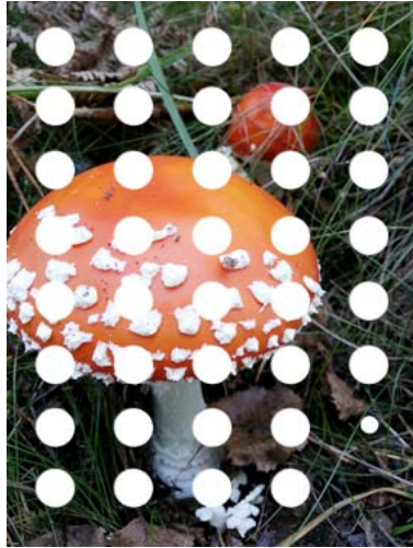
Bild in der Größe des vorderen Brettes drucken lassen. Zweites Holzbrett mit runden Bohrungen aufs Bild (Vorderseite zum Bild) drauf legen, Kreise abzeichnen und rausschneiden.